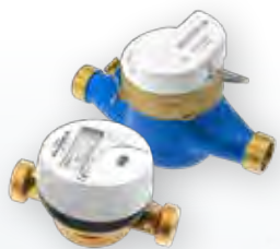
RESIDENTIAL Water Meters