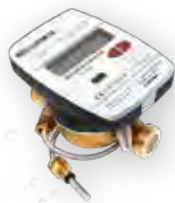
THERMAL ENERGY Meters