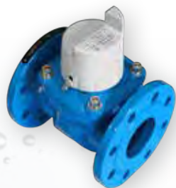
INDUSTRIAL Water Meters